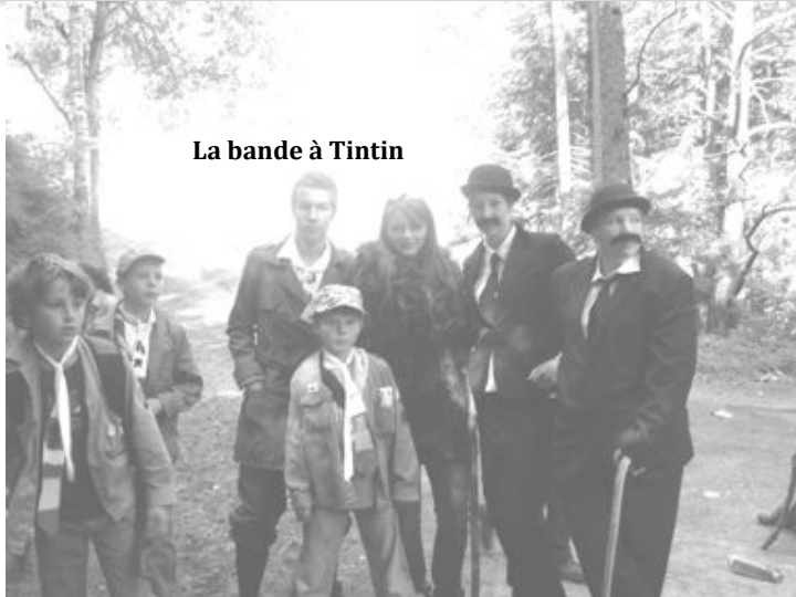
La bande à Tintin

Au menu, grand jeu et fiesta ! Tintin est aux aguets, alors que Rastapopoulos a plus de pouvoir que jamais... Article écrit par les Espagnols.