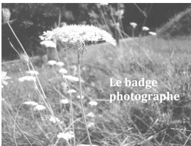
Le badge photographe

A 9h15, on a commencé l'activité "badges". Il y avait la possibilité de choisir entre : cuisinier, boute-en-train, musicien, reporter et photographe. Pour le badge cuisine, il fallait couper les légumes pour le dîner. Pour celui de musicien, il fallait apprendre les bases de la chanson "Le lion est mort ce soir" à la guitare pour accompagner durant la veillée. Pour celui de reporter, il fallait faire un article de journal sur la journée de lundi. Pour celui de photographe, il fallait