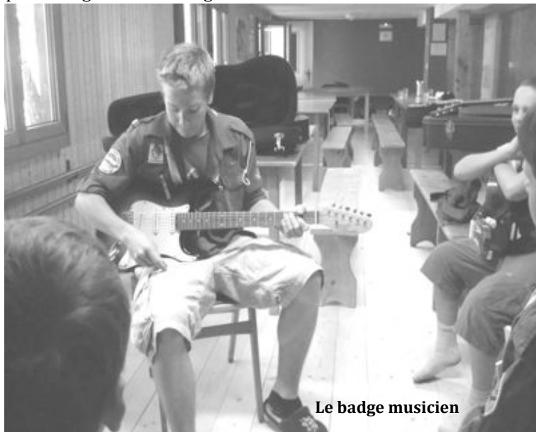
Le badge musicien

Le temps libre, en attendant le souper, nous a permis de préparer des bâtons pour griller les marshmallows de la veillée. Le super souper qu'Appaloosa nous a préparé était de merveilleuses pizzas.