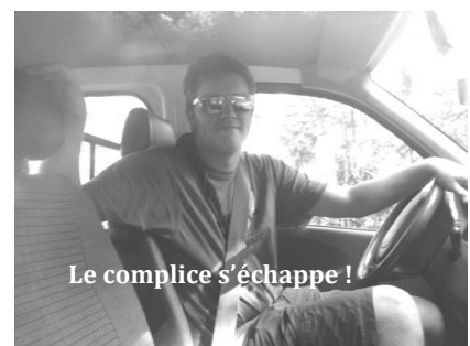
Le complice s'échappe !

Dupont : « Non, on a l'impression d'avoir un double de soi, on peut donc se parler comme à soi-même, s'auto-flatter. »