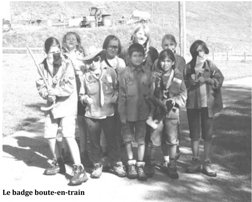
Le badge boute-en-train

Lors du dîner, on a mangé du couscous accompagné de saucisses et d'un mélange de légumes épicés. Après le repas, on s'est préparé pour la grande course