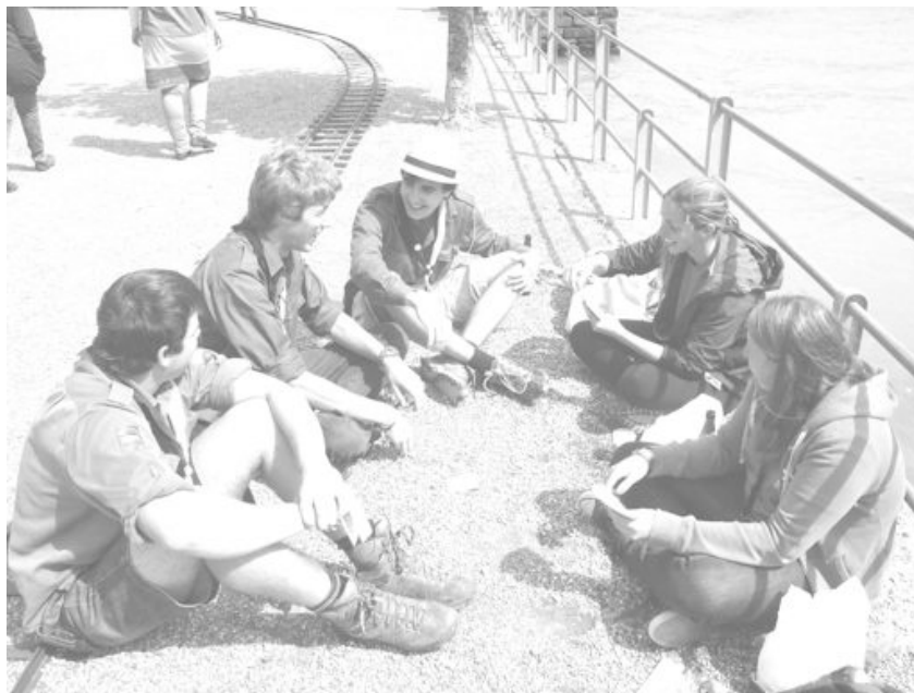
Albatros, Bouquetin, Caméléon, Kangourou et Tortue

Pour ne dire qu'une phrase au sujet de cette PFF, ce serait : Week-end de folie, vivement la prochaine PFF !!!