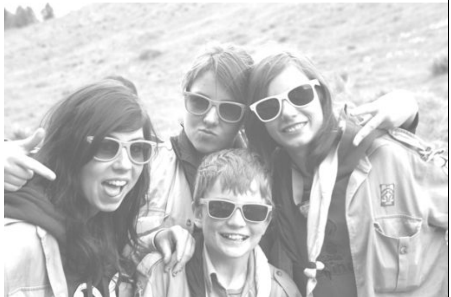
Pélican Briard Hulotte Vison