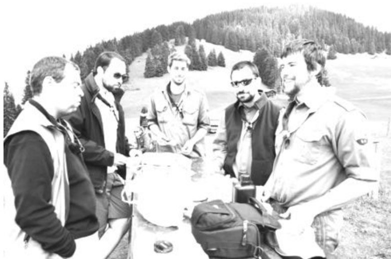
Pour le Clan, Salamandre

Et n'oublie pas, le Clan se réunit chaque 4 du mois... au moins. Alors si tu as une envie, une idée d'action, d'activité mixte Clan-maîtrise ou d'engagement bénévole, propose-la!