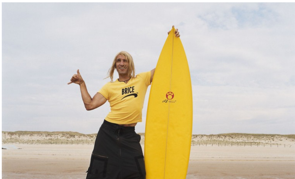
La maîtrise 2B

L'aventure de la plage continue ! Préparez-vous à affronter des défis déjantés, à surfer sur des vagues énormes et à tester votre esprit d'équipe. L'océan reste votre terrain de jeu, alors ne perdez jamais votre style ! À très bientôt pour la suite de l'aventure !